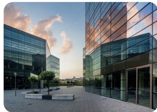
De functionaliteit van de EK-sloten wordt gebruikt in gebouwbeheersystemen van moderne kantoorcomplexen.