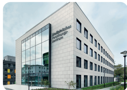
In onderzoekscentra mogen gevoelige laboratoriumruimten alleen worden betreden door een paar bevoegde personen. De EK-sloten maken deze besturingsfunctie mogelijk.