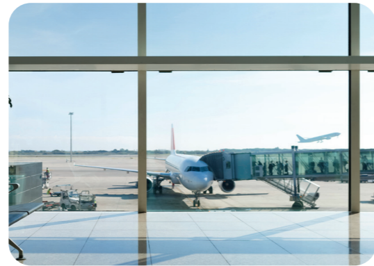
Op luchthavens is toegangscontrole en controle een essentiële taak.